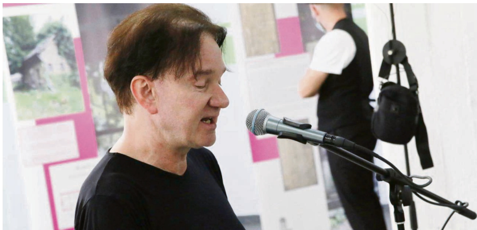
Blicker-Redakteur erinnerte an das Schicksal der jüdischen Zwangsarbeiterinnen in Lippstadt.

Ausgebucht waren die jeweils einstündigen Zeitfenster, in denen coronabedingt nur jeweils 20 Besucher ins Gebäude gelassen werden konnten. In dieser Stunde er-